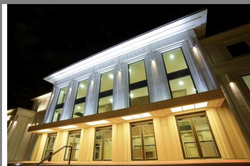
Éclairage nocturne de la façade principale