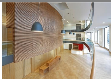
Accueil avec billetterie